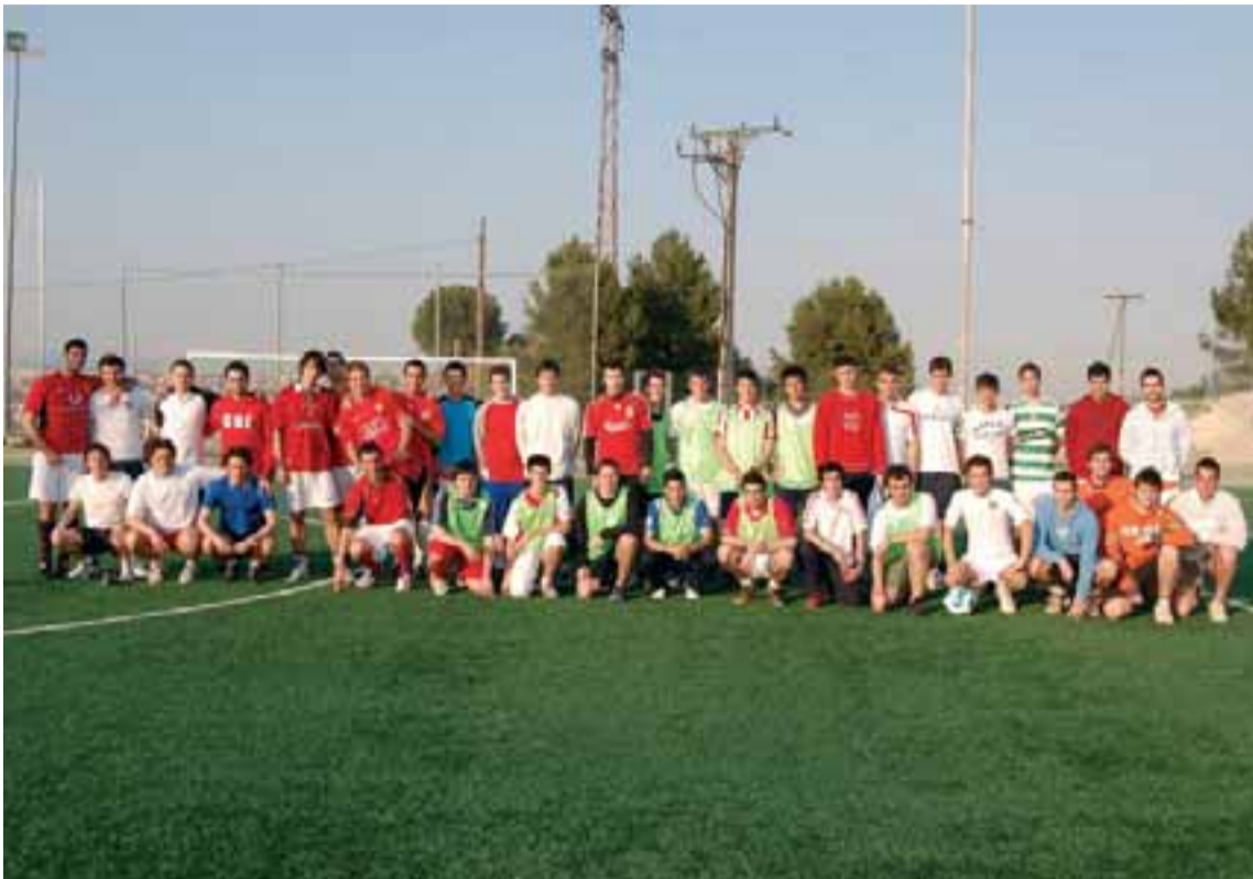
L'alineació de futbolistes que va participar en aquesta jornada esportiva

Primera trobada de joves que van practicar diferents activitats