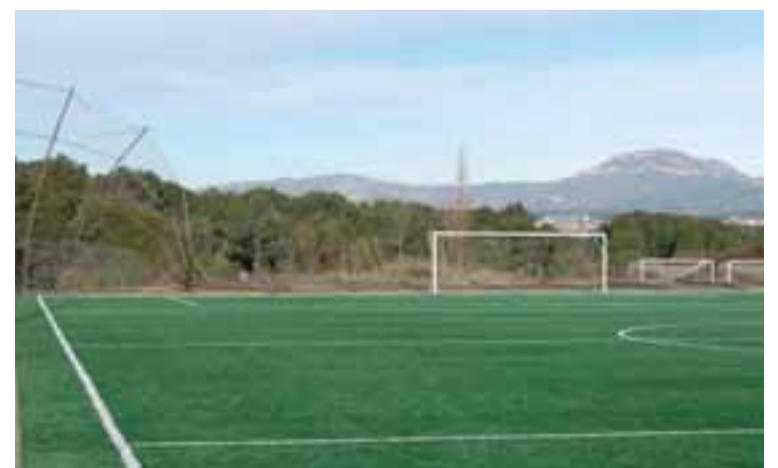
El tancat que va caure pel vent a la zona del camp de futbol

El Cercle Sabadellès 1856 no es va salvar de les fortes ventades que van sacsejar el país el cap de setmana del 24 i 25 de gener. Es van succeir la caiguda de branques i, sobretot, algunes tanques que envolten