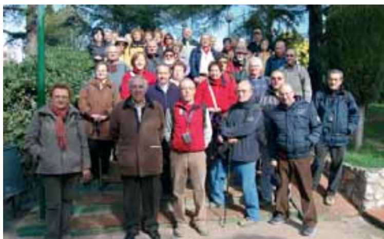
Els excursionistes de la UES que van participar en aquesta caminada pel rodal del Cercle Sabadellès