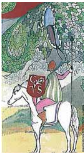
El punt de llibre que es regalarà a la Diada, junt amb una rosa

La jornada arrencarà a les 11 hores amb una gran xocolatada amb melindros, per després participar en un intercanvi de llibres i còmics. D'aquesta manera, cada soci podrà portar-ne un i rebre'n un altre. Paral·lelament, estarà exposat un gran llibre, amb les pàgines en blanc, en què es podran escriure suggeriments literaris, comentar algun llibre o donar consells. Una de les activitats més creatives de la Diada consistirà en escriure frases amb sentit en un gran mural i l'objectiu és