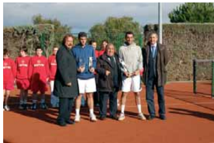
Imatge de l'entrega de premis de la final masculina