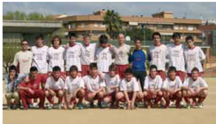
Els jugadors de l'equip cadet seran la base del juvenil federat la temporada vinent

Enguany, més de 150 jugadors formen l'escola de futbol del Cercle, i tot sembla indicar que aquesta xifra es podria augmen-