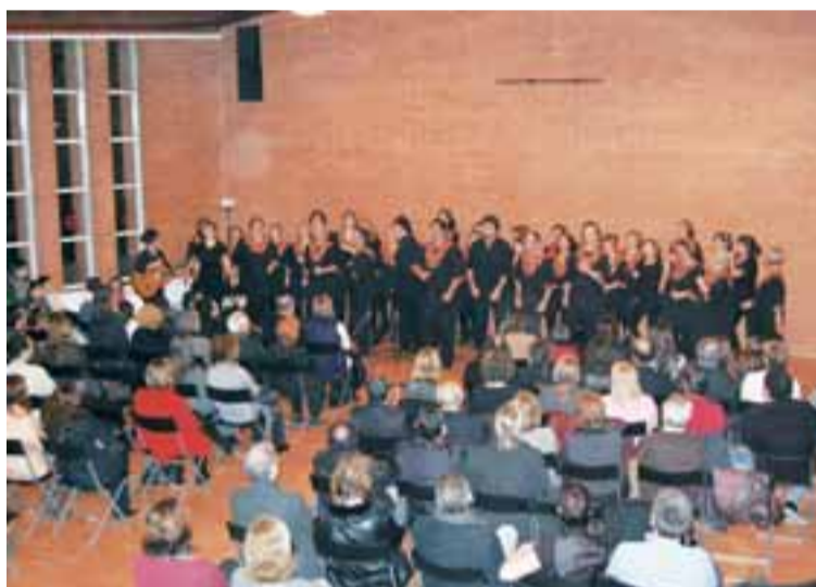
Moment de l'actuació del grup Ovnisingers In The Square

Una de les iniciatives que va comptar amb més participació va ser el concert de Gòspel, a càrrec del grup Ovnisingers In The Square, de l'Institut de Gòspel de Barcelona, que va tenir lloc el 20 de desembre. Una actuació que va ser un èxit de convocatòria, ja que es van superar les previsions davant un públic entregat.