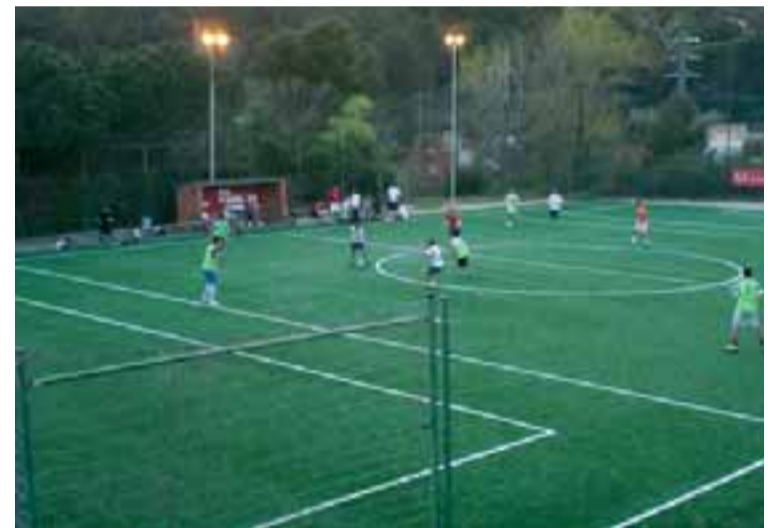
Imatge d'un dels partidets de futbol en aquesta trobada

bòlica competició. En les classes dirigides es va poder practicar, entre d'altres, body pump (que es pot practicar de manera setmanal al Cercle) i que va tenir molt èxit en aquesta Tarda Universitària.