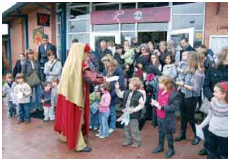
El Missatger Reial va atendre els joves socis de l'entitat

Per altra banda, cal destacar l'èxit que va tenir la iniciativa de recollida de joguines del Club. Enguany, se n'han aconseguit més d'un centenar que, de ben segur, van disfrutar aquells amb menys recursos.