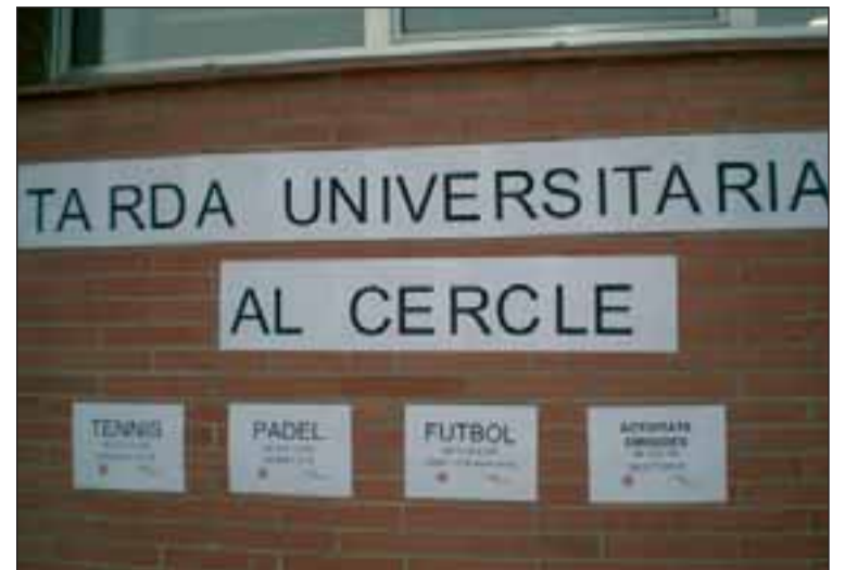
El programa d'activitats esportives per als universitaris

Però el tennis no va ser l'únic esport de la jornada, ja que es va deixar la raqueta per jugar a futbol i participar de les activitats dirigides. Precisament, el futbol va comptar amb molta afluència, prop de 40 jugadors, fet que va permetre formar sis equips que van jugar als dos camps que disposa el Club. Sota el sistema de triangular, només un es va proclamar guanyador d'aquesta sim-