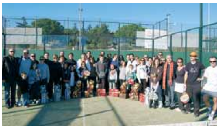
A la foto superior, els participants del torneig de tennis, i en la inferior, els de pàdel