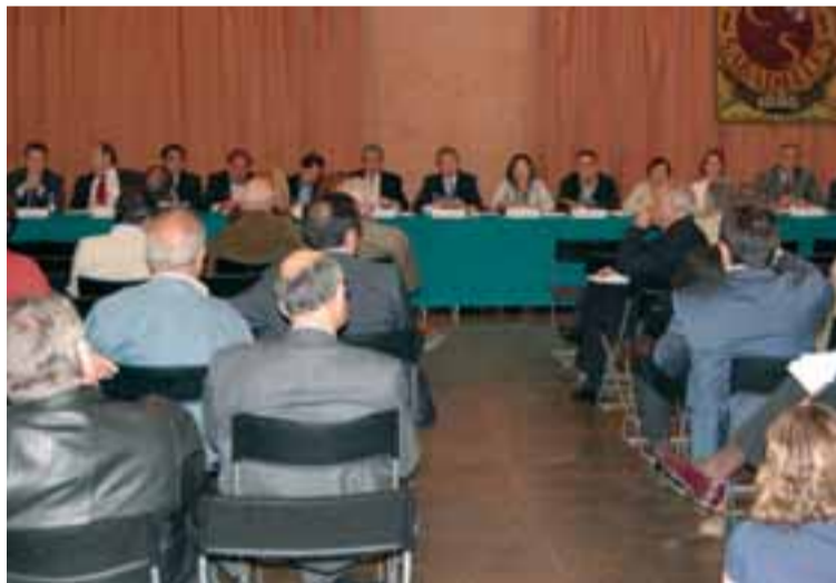
Durant l'Assemblea es repassaran les activitats esportives i socials del darrer exercici

Posteriorment, a partir de les 20 hores, es celebrarà l'Assemblea Extraordinària de Socis per tal de modificar els estatuts de l'entitat que es poden consultar al web www.cerclesabadelles.cat . El