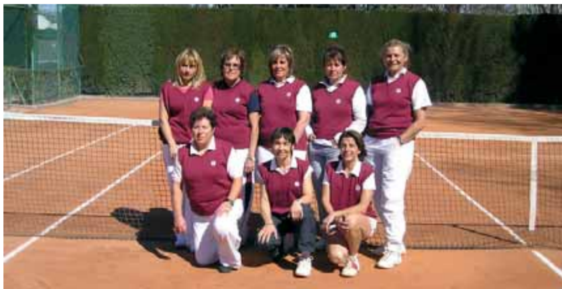
Algunes de les participants del Cercle Sabadellès 1856 al Campionat d'Espanya de veteranes

El Cercle prendrà part en aquesta competició en totes les categories en joc i és en +40 i +60 on té moltes opcions de fer la sorpresa. Es juga a casa i, per aquest motiu, s'espera comptar amb el suport de l'afició. Serà l'oportunitat de veure en acció exjugadores d'elit que segueixen en actiu en el món del tennis.